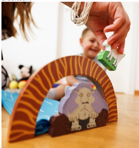
6 Språkstart Halland på hembesök

Kopplingen till hållbar utveckling och näringsliv stärks genom arbetet med kulturella och kreativa branscher. Genom medverkan i utvecklingen av SPOK Halland bidrar regionen till att synliggöra lokala produktionsmöjligheter inom bild och form, med fokus på cirkulära och platsbaserade arbetssätt.