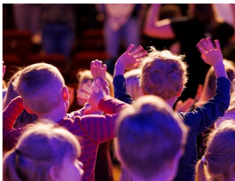
4 Rösträtt - sång på förskolan

Utvecklingen visar på ett ökat fokus på strukturer och samverkan, men också på behovet av fortsatt arbete för att minska skillnader mellan kommunerna.