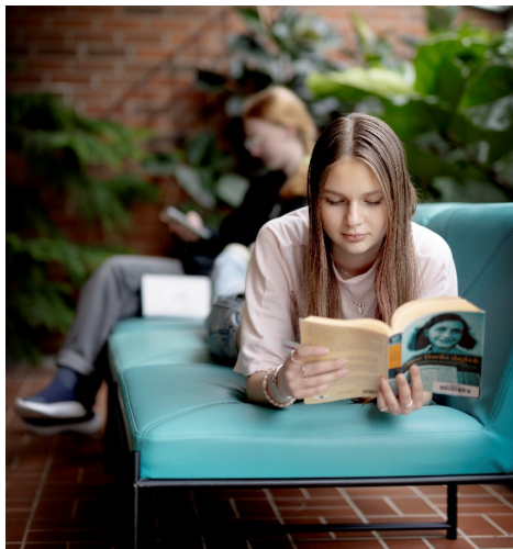
7 Munkagårdsgymnasiets bibliotek

Även hållbarhetsperspektivet har stärkts. I samband med nya överenskommelser har kraven på arbete med miljö och klimat tydliggjorts, och förändrade arbetssätt, som exempelvis justerad hantering av Språkstart Hallands material, har bidragit till minskade transporter.