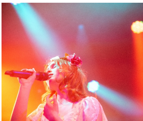
3 Change Music Festival

Även institutionernas arbetssätt förändras. Musik Hallandia har i högre grad öppnat för externa initiativ och fungerar tydligare som en resurs för arrangörer och musiker.