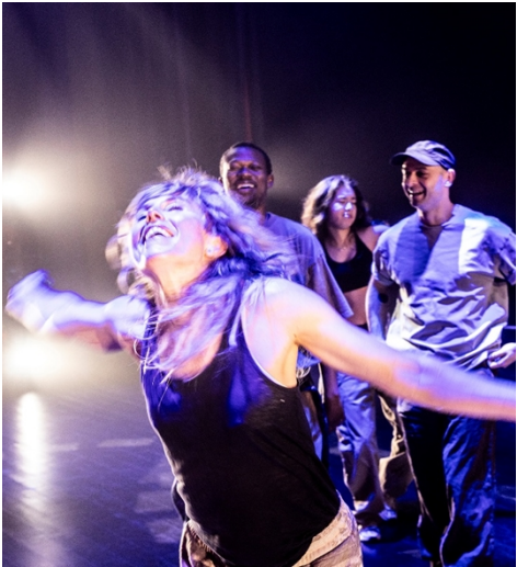
1 DOKS – Dans över gränser

En central utgångspunkt i arbetet är att verka i skärningspunkten mellan konstnärlig kvalitet och relevans. På så sätt stärks de konstnärliga perspektiven samtidigt som den halländska publiken står i centrum.